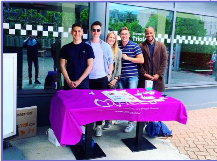
Les membres de la CECDM au stand Gardez le Sourire.