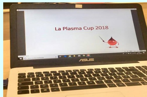
Présentation et promotion de l'opération auprès des étudiants.

La Plasma Cup, défi mettant en compétition différentes écoles et facultés des villes de Montpellier et Nîmes, s'est déroulée du 5 novembre au 7 décembre. Elle a pour but de récolter le plus grand nombre de dons de plasma possible afin de répondre aux besoins des malades, besoins qui ne cessent de croître chaque année. C'est donc dans une logique solidaire et altruiste que la faculté d'Odontologie a participé pour la première fois à la Plasma Cup. Son caractère d'établissement de santé et sa proximité avec l'EFS, lieu de récolte des dons, font de la faculté d'Odontologie un participant de choix pour la compétition. Différents éléments de communication ont été mis en place tout au long du mois pour motiver les étudiants mais également le personnel et les enseignants à aller donner de leur temps et un peu de leur corps pour cette noble cause. L'ensemble de l'opération a permis de récolter de nombreux dons, dont 2 seulement sont attribués à la faculté d'Odontologie. Mais il est certain que ce résultat s'améliorera au fur et à mesure des éditions et peut-être même que la faculté d'Odontologie remportera un jour ce beau challenge. Réponse en 2019 !