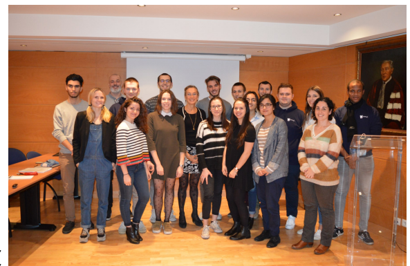
Promotion DFGSO2 de l'ELC Initiation à la Recherche.