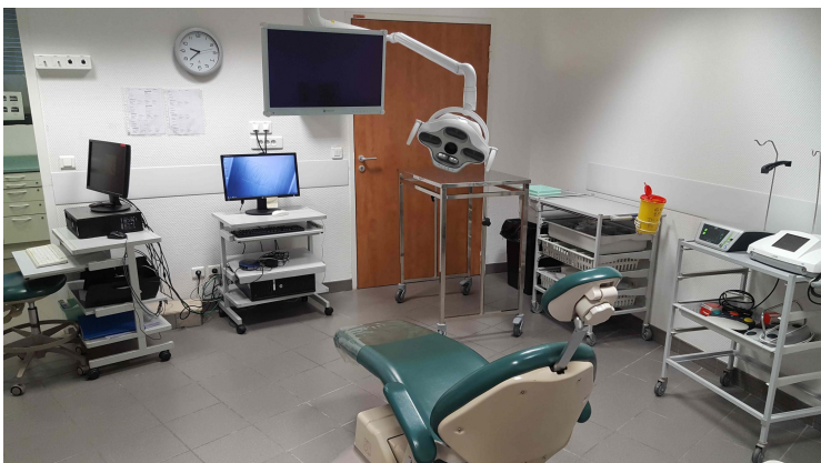
Nouvel éclairage scialytique avec caméra automatique pour prise de vue installé au Centre de Soins Dentaires.

La commission pédagogique aura la charge de « modéliser et suivre » l'ensemble de ces nouvelles techniques pour le bien-être du soigné et du soignant.